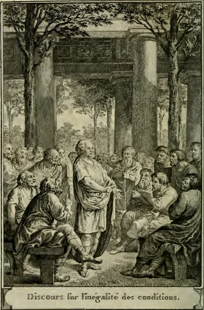
Discours sur l'inégalité des conditions.